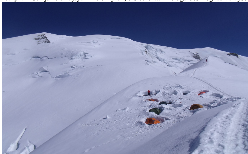
Stanová základna u chaty Gouter ve výšce 3817 m.n.m.

4362 m n. m. Nedostatek spánku a řídký vzduch s kombinací poměrně vysoké nadmořské výšky s námi docela cvičily. Oba spolulezci si již od 3500 m n. m. stěžovali na menší či větší bolesti hlavy a nevolnost. Oboje se mě naštěstí vyhnulo. Po krátkém spánku se to zlepšilo, ale při zdolávání dalších výškových metrů problémy s aklimatizací gradovaly. Nicméně po odpočinku na chatě Vallot jsme se vydali na posledních 500 m převýšení. Třetí den, 4. července 2011 o půl deváté ráno jsme dosáhli našeho cíle – Mont Blanc. Dlouho jsme se nezdržovali a spustili se zpět ke stanu. Chtěli jsme sestoupit až k chatě Tete Rouse, ale počasí nám v tom zabránilo. Obloha, která byla doposud po celé tři dny modrá, téměř bez mráčku, se zatáhla a začalo sněžit. Raději jsme ještě zůstali na noc ve stanu. Ráno už zase svítilo sluníčko, sbalili jsme stan i všechny věci a odpoledne už jsme byli zpět u auta v Les Houches. Tam jsme se najedli, naskočili do vozu a s dobrým pocitem odjžděli domů.