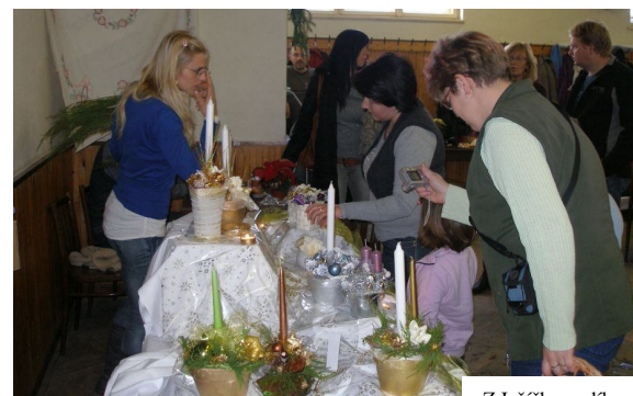
Z Ježíškovy dílny

Zastávku můžeme také uskutečnit u dne 23.10. při světélkování v Habrůvce . Lampiónový průvod obcí, lemovaný loučemi, doprovázený světelnými efekty, zakončený na místním hřišti velmi malým ohňostrojem a pokusem o vypuštění přáníček. Tak lze stručně hodnotit tuto akci ve větrném, chladném dni, kde teplé občerstvení přišlo vhod. Tradicí se stalo rozsvícení obecního vánočního stromu na návsi. Před první adventní nedělí jsme se sešli na tanečním parketu, pod zaschlou hodovou májí, za asistence čerta, Mikuláše a anděla, při zpěvu vánočních koled, za doprovodu harmoniky spojené s popíjením horkého čaje a svařeného vína. Impulzem k rožnutí stromu, pod kterým naše děti dostaly dárečky od Mikuláše, byl ruční, zřejmě kravský zvonek. Stromek se stal v tuto dobu dominantou noční obce, která potrvá pravděpodobně až do Tří králů. Poslední akce se uskutečnila 4.12. v kulturním sále, který se proměnil v Ježíškovu dílnu .