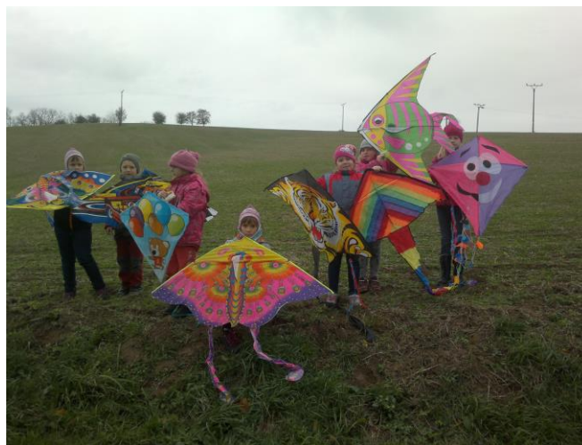
Školní družina - Drakiáda